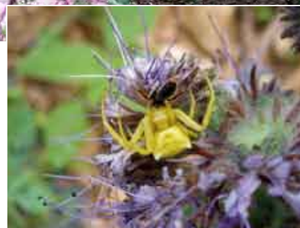
Un auxiliaire de la vigne : Thomisus