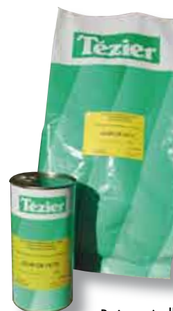
Sac étanche de 4 kg

Nos semences sont conditionnées en boîtes métalliques de 400 grammes (dose pour 500 à 1000 m 2 ) ou en sac dose de 4 kg. Ces conditionnements utilisés par les professionnels sont étudiés pour vous garantir une conservation optimale de la graine, qui, ne l'oublions pas, est un produit vivant et requiert donc le plus grand soin.