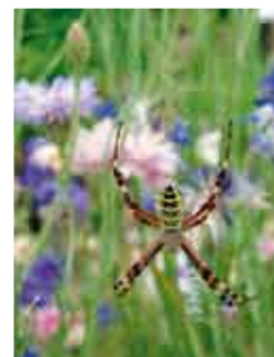
Un auxiliaire de la vigne : l'Argiope femelle