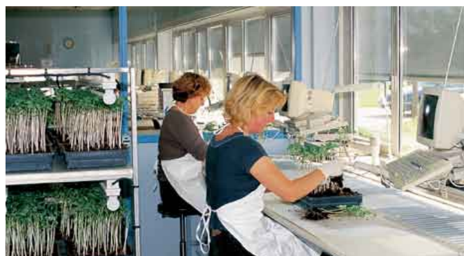
Laboratoire de contrôle de la germination

Toutes nos productions sont contrôlées à Valence afin de vous garantir qu'elles ne contiennent pas de graines de mauvaises herbes ou d'agent pathogène par exemple, mais aussi que les mélanges sont bien équilibrés et fiables.